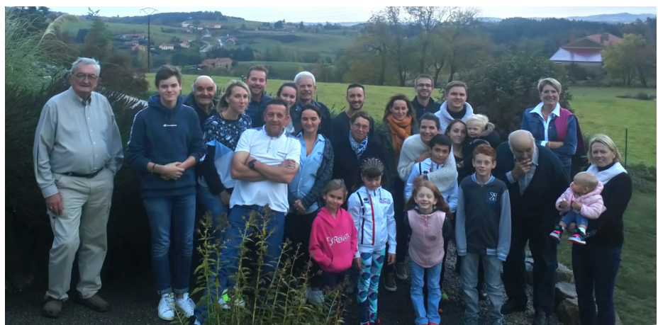
table pour partager un repas où chacun avait confectionné un plat. La nuit tombait déjà et il fallait penser à rentrer. Les plus jeunes restaient et terminaient à une heure avancée de la nuit.

L'heure tournait et il était temps de se mettre à